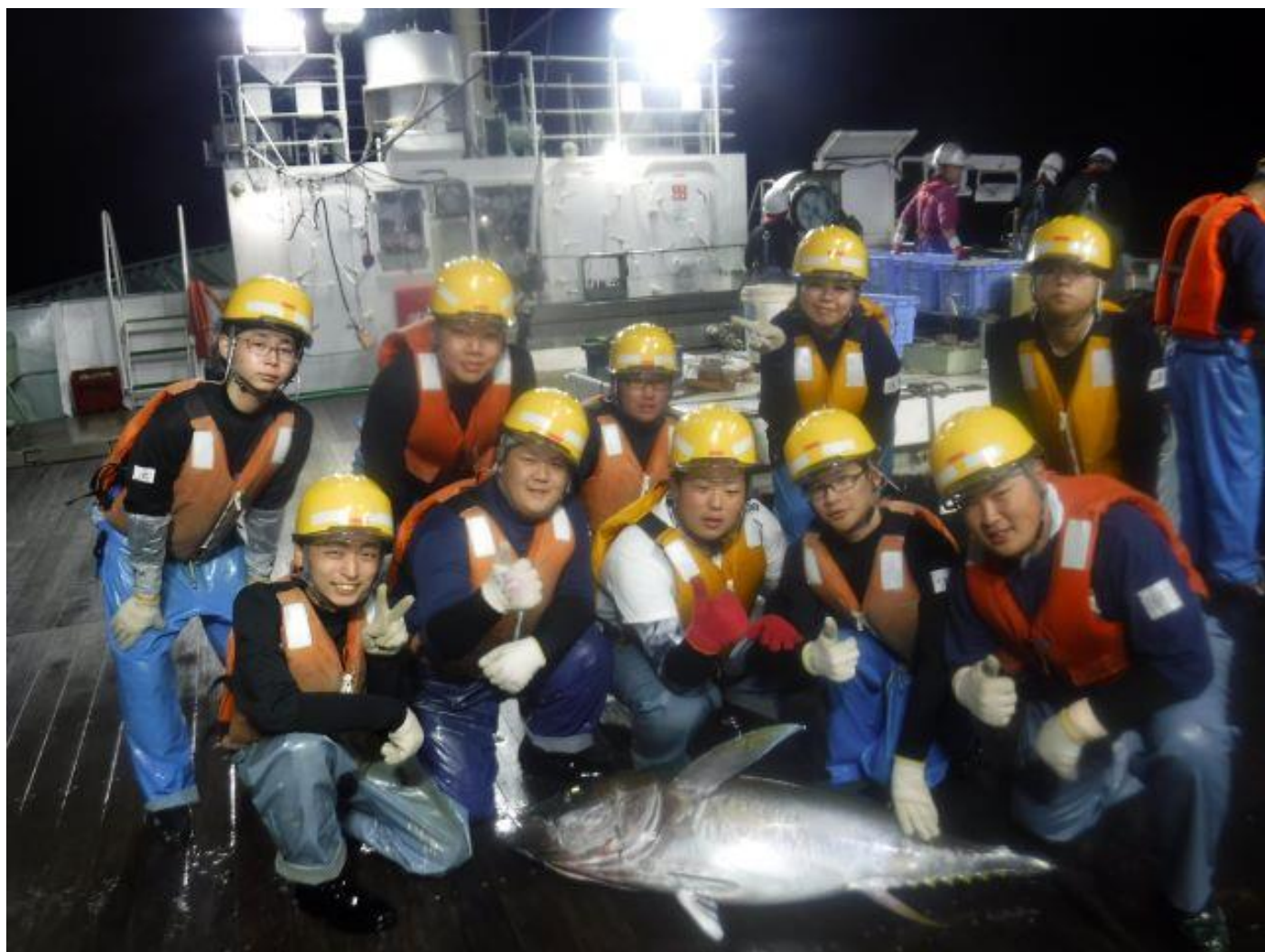
メバチと一緒に、いい笑顔です